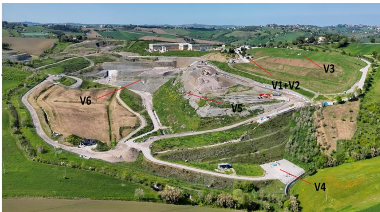
Foto aerea con ubicazione vasche/pozzi percolato (V1+V2, V3, V4, V5 e V6)

Il percolato nella vasca/pozzo V5 non viene campionato perché raccoglie il percolato del 1° lotto che viene campionato nella Vasca V4.