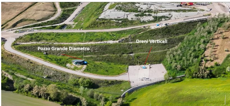
Individuazione punti campionamento Pozzo grande diametro e dreni verticali

ASA S.r.l. Azienda Servizi Ambientali Via San Vincenzo, 18 60013 Corinaldo (AN) Capitale Sociale € 25.000 Nr. Iscr. reg. Imprese AN e C.F.: 02151080427 telefono: +39 071 7976209 e-mail: info@asambiente.it PEC: asambiente@pec.it sito internet: www.asambiente.it Impianto di smaltimento Via San Vincenzo, sn 60013 Corinaldo (AN) Tel. +39 071 7976369 e-mail: accettazione@asambiente.it PEC: asambiente@pec.it