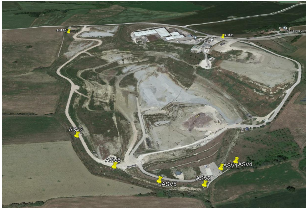
Individuazione punti campionamento acque sotterranee